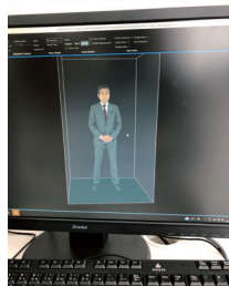
パソコンに取り込み